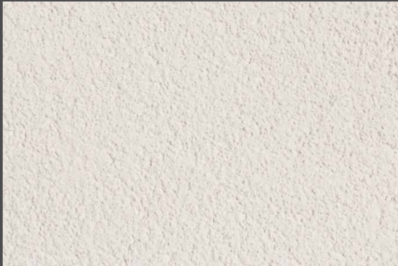
The very origin - L'origine même Finition : Stolit K1,5 Teinte : Blanc non teinté