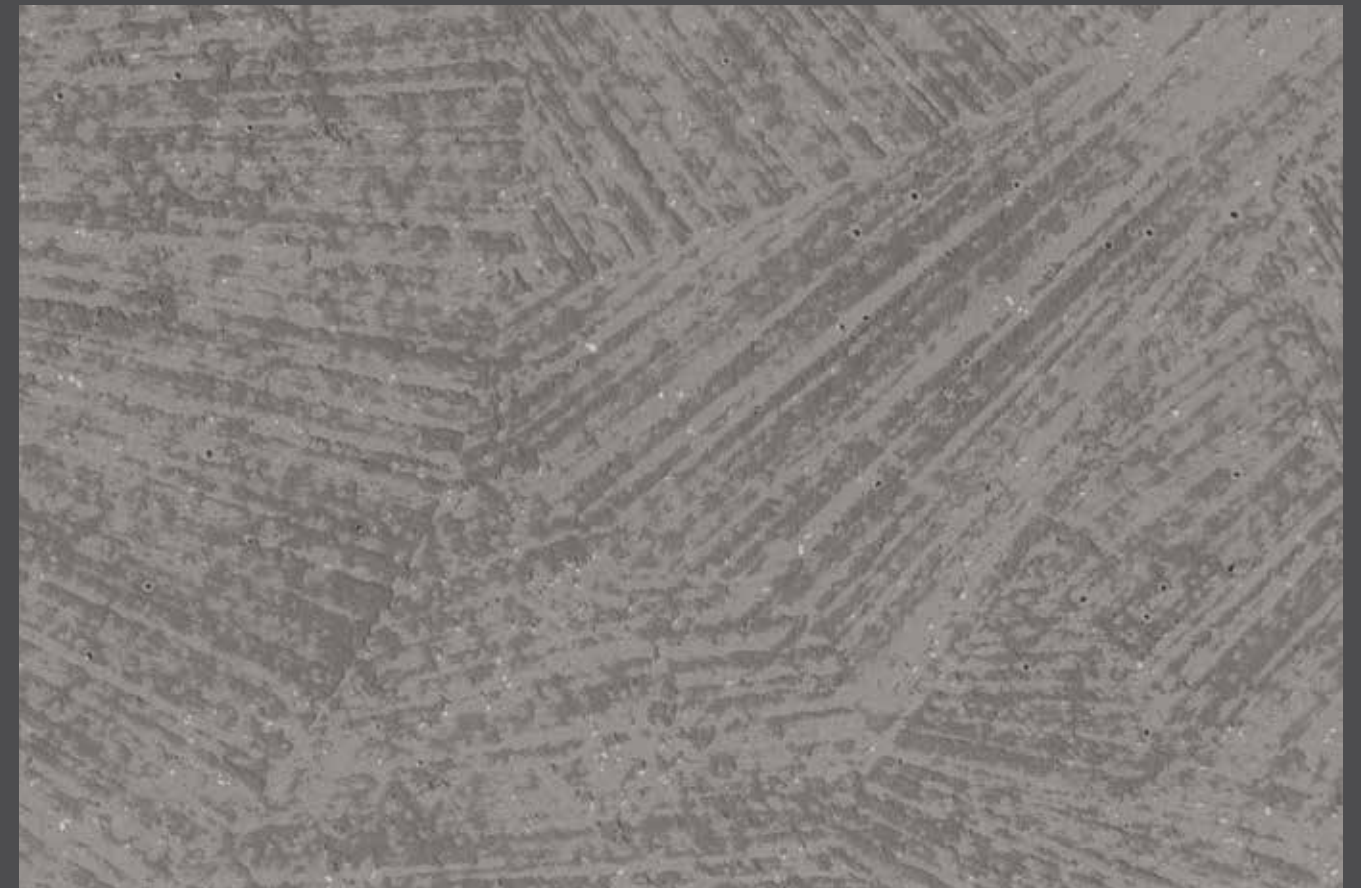
Concrete veil - Aspect béton