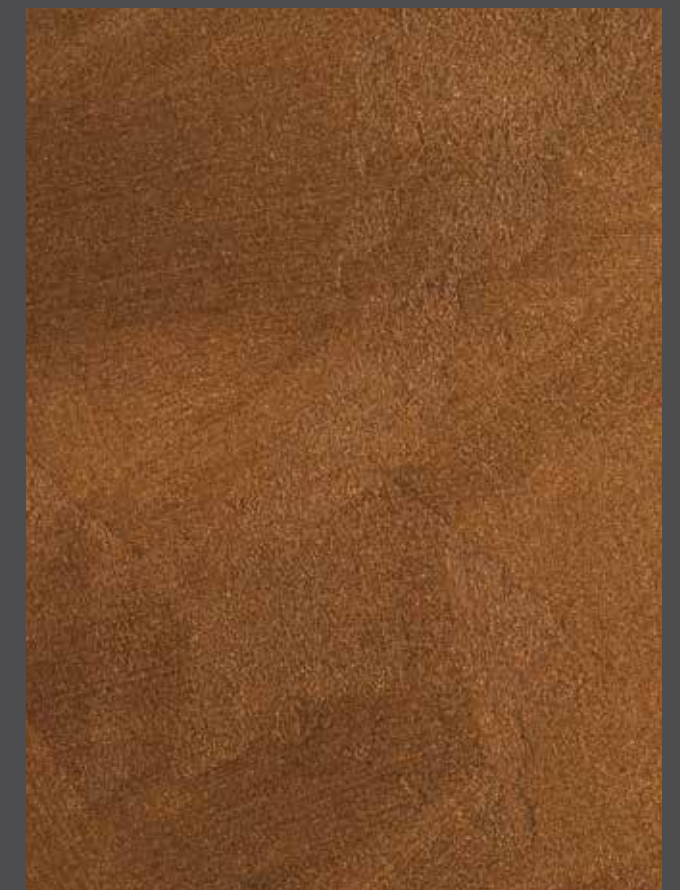
Oxidized - Oxydé

Finition : Stolit Milano aspect Marmorino + StoColor Metallic lasuré