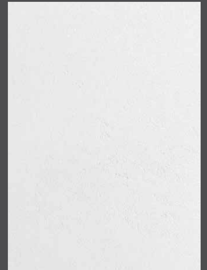
Pebble - Galet