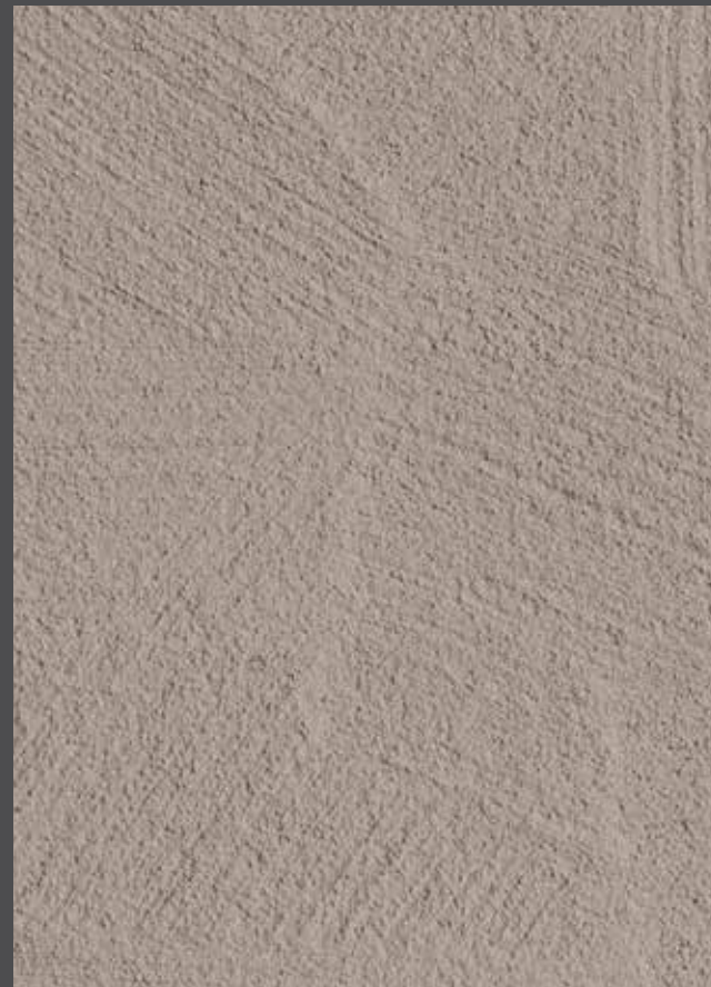
Simply Brushed - Tout simplement balayé