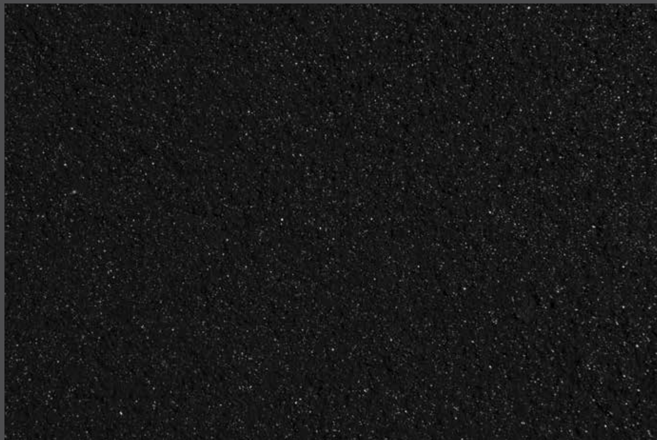
Black diamond - Diamant noir Finition : Stolit K2 + StoColor Maxicryl + projection de Carbure de Silicium Teinte : 37100 ■ 5 C2