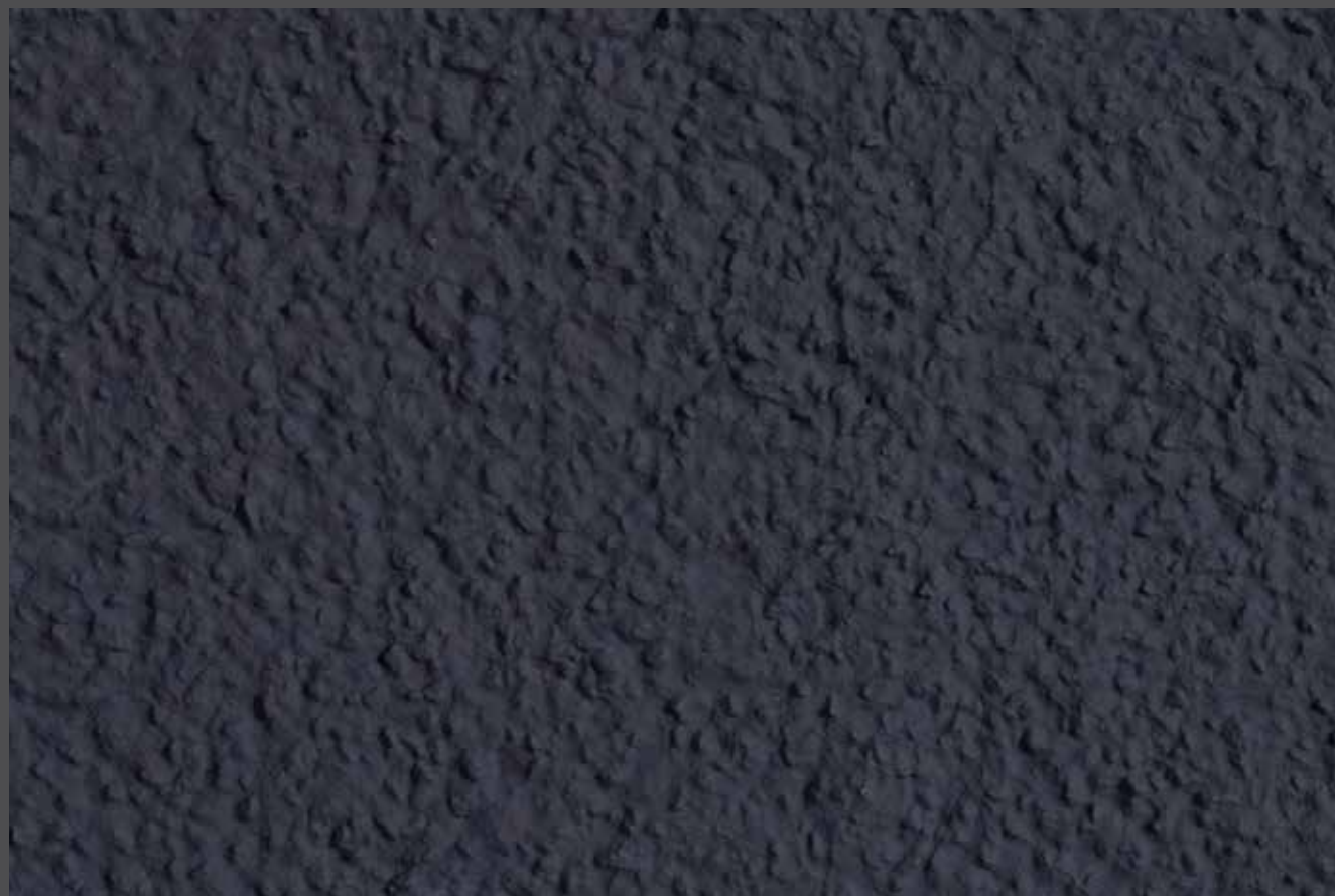
Purple rainstorm - Orage pourpre