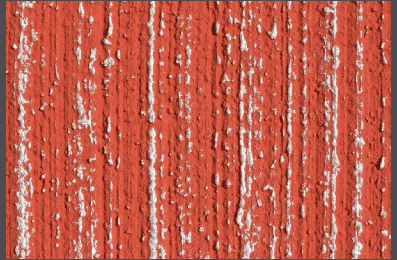
Silver stripes - Crêtes argentées

Finition : Stolit Effect balayé + StoColor Métallique sur crêtes