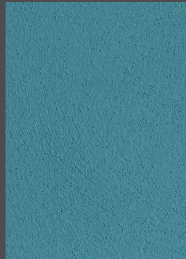
Turkish stone - Turquoise

Teinte : 74300 ■ 10 C3 △ (uniquement pour façade ventilée)