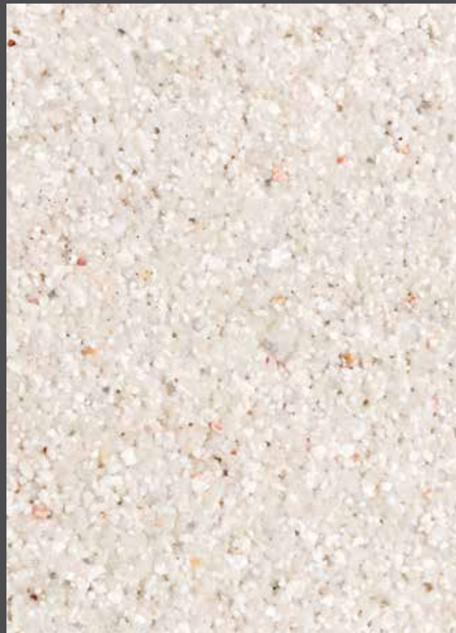
White marble nuggets - Pépites de marbre blanc