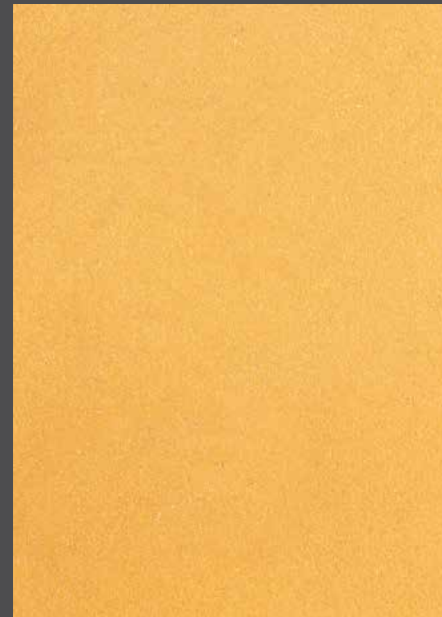
Raw bullion - Lingot brut

Finition : Stolit Milano poncé + StoColor Métallique lasuré