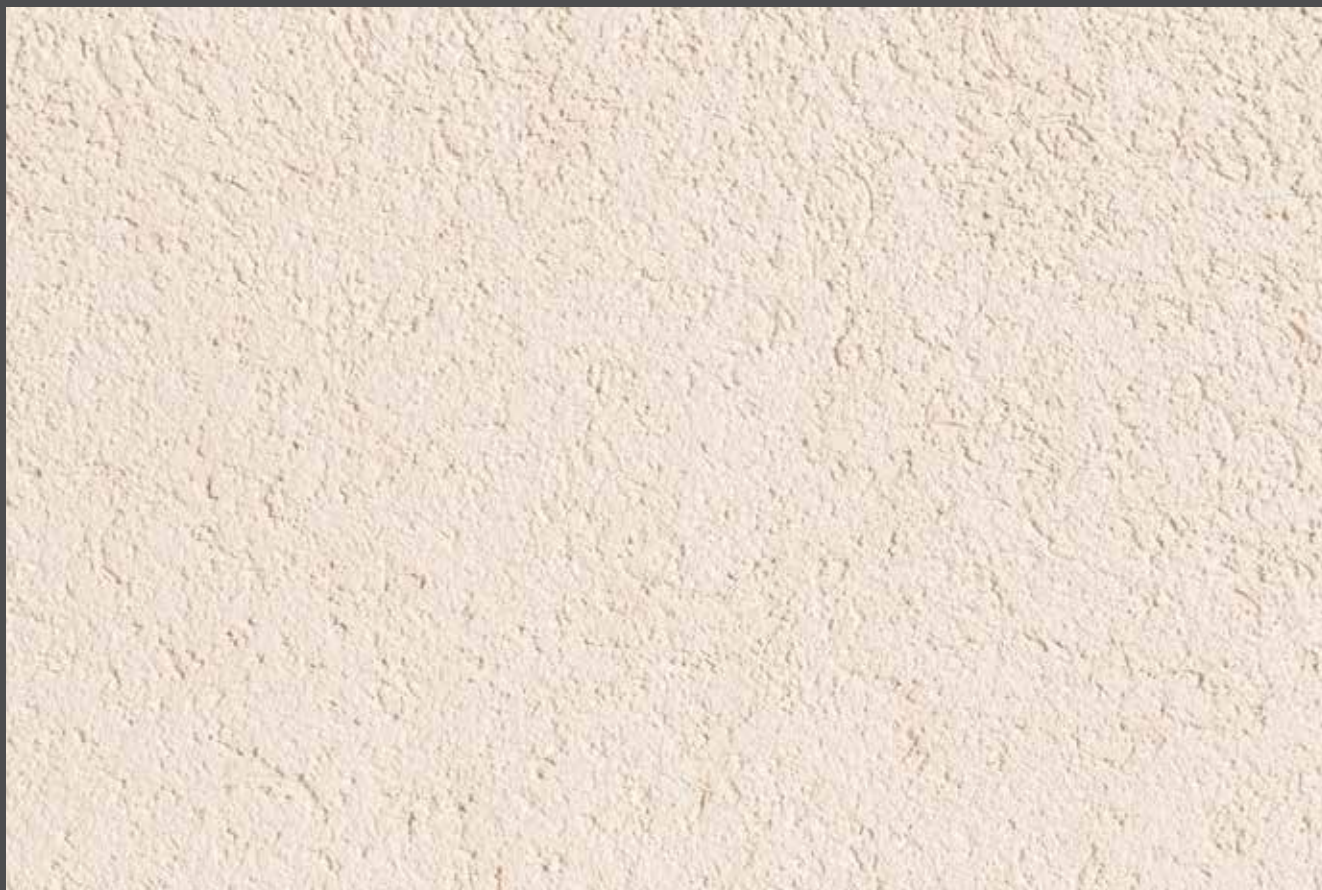
Heritage - Héritage

Teinte : 73100 ■ 13 C3 + 37810M (uniquement pour façade ventilée)