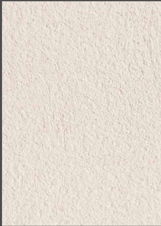
Soft lime - Chaux naturelle

Teinte : 16065 ■ 60 C1 ○ △ + 16090 ■ 38 C2 ○ △