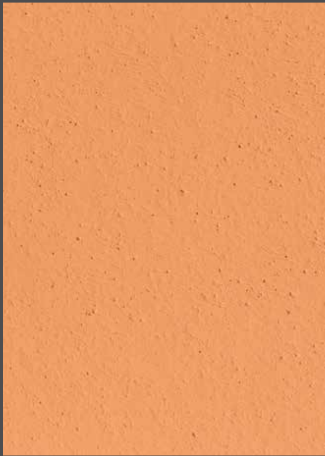
Tuscany - Toscane

Finition : StoMiral MP feutré + StoColor Badigeon