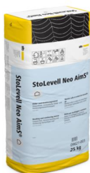
Nouveau sous-enduit d'ITE StoLevell Neo AimS®