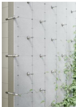
Nouveau système StoFix Iso-Bar ECO pour végétaliser les façades