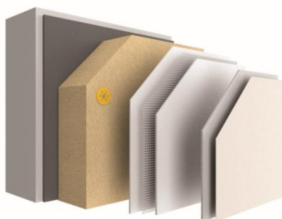
Nouveau système ITE StoTherm Wood AimS® avec isolant en fibre de bois