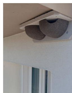
Nichoir StoElement Fauna en applique de façade pour les hirondelles de fenêtre