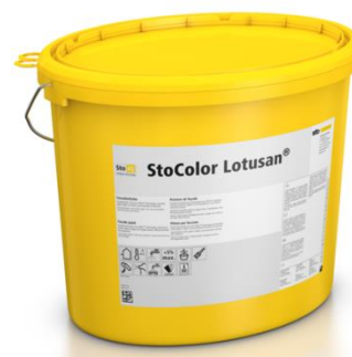
Enduit StoColor Lotusan® aux propriétés autonettoyantes