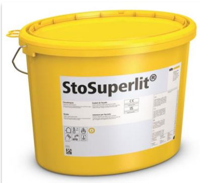
StoSuperlit est disponible en granulométrie 1,5 mm et désormais en 0,8 mm