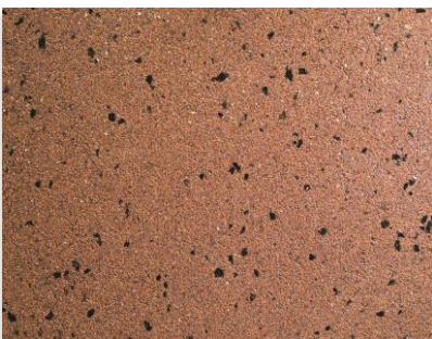
Nouvel enduit StoSuperlit K 0,8 avec sa texture ponctuée d'éclats de mica