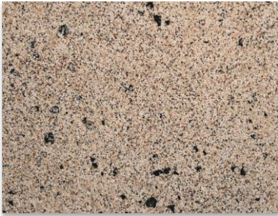
Nouvel enduit StoSuperlit K 0,8