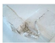
Présence de métal