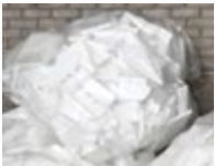
Sacs non Sto