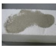
Résidus de colle ITE