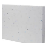
Absence de billes jaunes