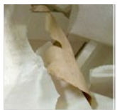
Présence de scotch