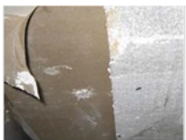
Présence de carton