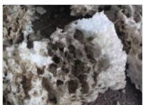
Résidus de ciment